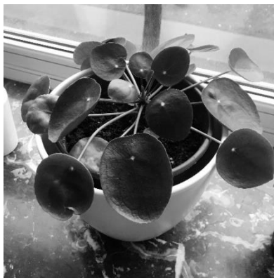
Stef na het verpotten

PS: Senior is opnieuw zwanger! Wie deel wilt uitmaken van dit ontroerende verhaal, kan zagen om een stekje bij Melanie (redactie). Potentiële pleegouders worden natuurlijk grondig gescreend. – nvdr