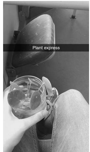
Opgepast: baby aan boord

Wonder boven wonder bleek enkele dagen later de geliefde Senior zwanger te zijn, van een liefvallige tweeling. Na de geboorte werd de tweeling net als in The Parent Trap opgesplitst. Een baby ging naar Evelyn en kreeg de naam Stef, de andere ging naar Maud. Even later bleek echter dat de laatste een Siamese tweeling was!!! Puur geluk in bladvorm. Na een zeer moeilijke operatie uitgevoerd door gediplomeerd plantendokter Maud, werden ze succesvol gescheiden. Vanaf dat moment gingen ze door het leven als Stek en Stak.