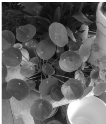
Na succesvolle operatie: Stek en Stak