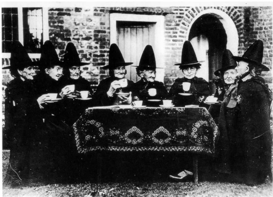
Sferbeeld van de laatste vergadering

Met een beetje geluk heeft u deze liefvallige dames en heer al mogen ontmoeten. Lees hier alles over hun diepste verlangens en verborgen talenten. Noem het een vriendenboekje!