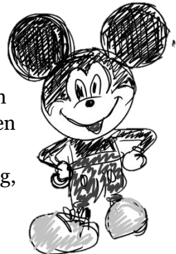
Blind tekenen like a pro

De winnaars van de marshmallow-spaghettitoren hebben de opdracht op een creatieve manier aangepakt. Ze hebben een 2,60m hoge toren gebouwd... tegen een muur! Dit was natuurlijk niet de bedoeling, maar again, we hadden niet vermeld dat het niet mocht. Dus voor jullie ook, proficiat voor de creativiteit! ☺